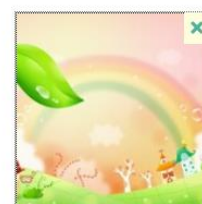
Фото автора сайта или эмблема организации. Будет использоваться в шапке сайта в качестве логотипа и в информационной карточке на главной странице (если выбран соответствующий вариант оформления). Минимальный размер изображения 400x400 пикселей.